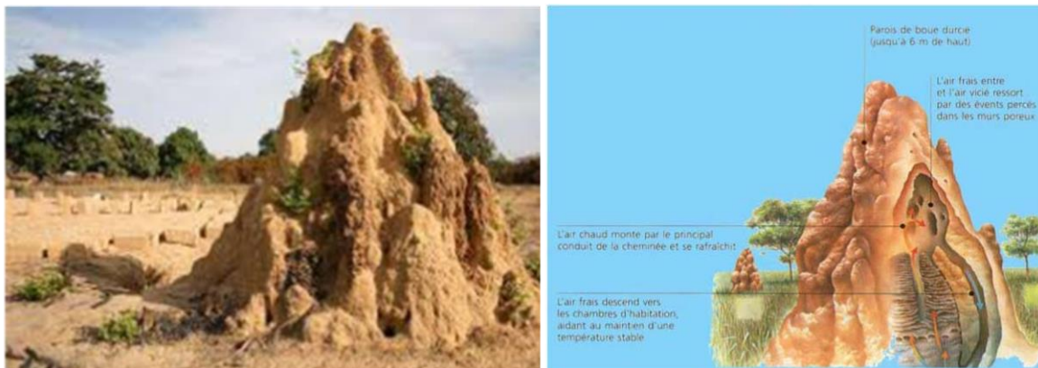
Figures 2. Explication de la ventilation dans les termitières,

Dans les années 1990, Mick Pearce, architecte de nationalité zimbabwéenne s'est inspiré des termitières construites par des termites champignons qu'il a vues dans la nature. Les insectes ont pu créer leurs propres systèmes de climatisation qui faisaient circuler l'air chaud et l'air frais entre le monticule et l'extérieur (voir Fig.2). Une source d'inspiration qui l'a permis la conception de ce Mall/hyper centre commercial, joyau architectural situé au centre de la ville de Hararé.