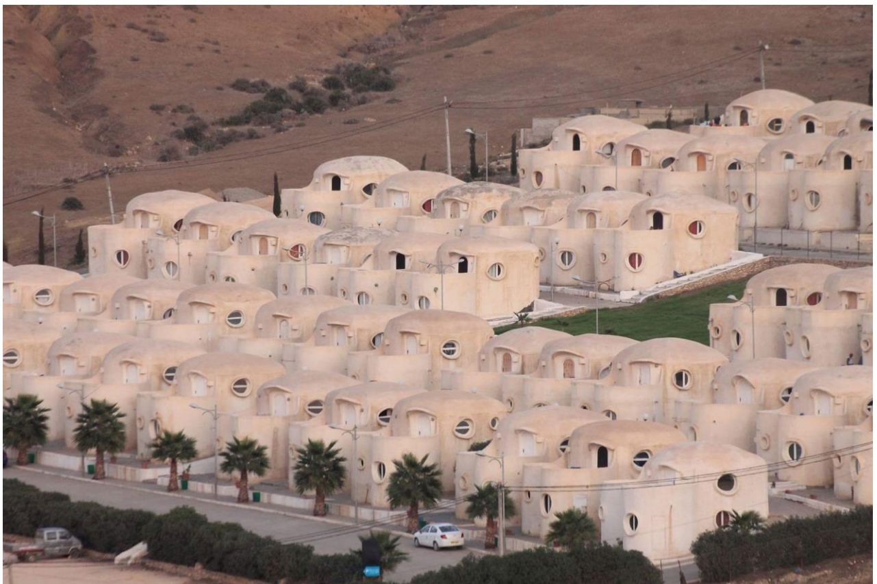
Figure 9. Vue d'ensemble du projet touristique de Bouzedjar, Source : https://www.facebook.com/Village-Touristique-Medina-Grataloup-1337870552946944/photos/a.1337902192943780/1624841597583170 (consulté en Aout 2022). Ce quartier serait classé au rang de ville nouvelle dans certains horizons de l'Afrique.

Aussi, la particularité de ce projet, réside dans la capacité de maintenir la température ambiante des logements à une température constante malgré les variations de température durant l'année. Ce confort thermique est surtout favorable grâce à sa position adossée sur les flancs des montagnes, les matériaux de construction, mais aussi les caractéristiques intrinsèques aux baies, leurs orientations, leurs formes (voir Fig. 8).