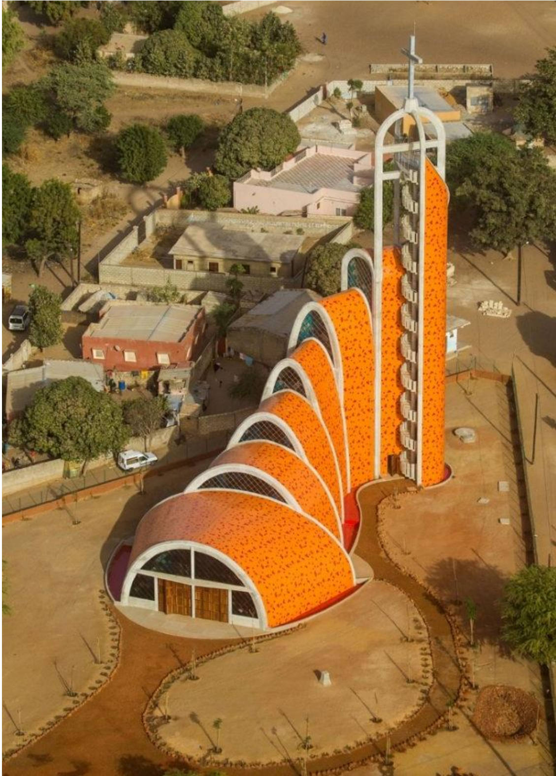
Figure 7. Vue panoramique de l'église de l'Épiphanie à Nianing. Cette image permet d'apprécier l'ancrage monumental dudit du projet dans son environnement urbain immédiat.

Creative Commons Attribution-Non Commercial-No Derivatives 4.0 International License (CC BY-NC-ND)