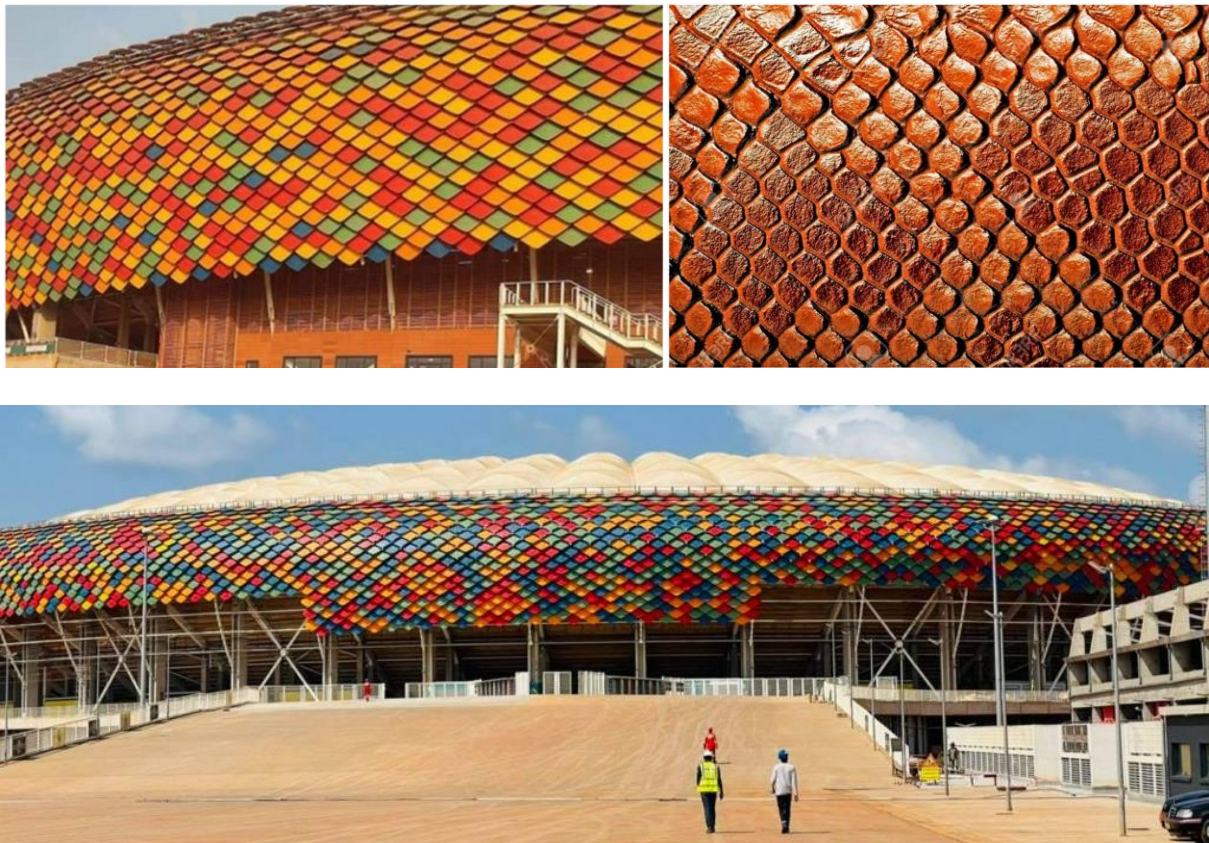
Figure 5. Vue d'ensemble du stade Olembé-Yaoundé-Cameroun, source : Traiter à partir https://www.crtv.cm/2021/11/olembe-stadium-works-concluded-and-reception-billed-for-december-3/ . Cette figure recollée met en évidence, la ressemblance dudit projet, mais aussi les détails de la forme du stade, mais surtout de l'imitation des écailles des reptiles.

Situé à Yaoundé, capitale politique du Cameroun, a abrité la cérémonie d'ouverture de la Coupe d'Afrique des Nations de Football de l'édition 2021 (voir Fig. 5). Parmi les nombreux projets de cet ordre comme la tour Eiffel mimant la structuration de l'os, nous avons en occurrence cet équipement du sport international, qui incarne la volonté manifeste de la signature architecture du concepteur. Construit prioritairement pour les compétitions internationales de football, ce joyau architectural tire son inspiration du python géant, le reptile symbolique des premiers habitants des lieux : ainsi, l'architecture par le moyen du biomimétisme permet aussi une forme d'appropriation culturelle dans la production et la fabrique du territoire.