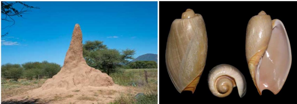
Figure 6. Termitière et coquillage de cymbium. Ces deux organismes naturels de part leurs différences apparentes, et dont l'ingéniosité du concepteur à su unifier les forces, démontre la créativité qui se cache derrière cette théorie.

Ainsi, ce projet a reçu le prix : architecture Masterprize 3 winner 2019, global architecture and design award winner 2019, faith and form winner 2019, international design award honorable mention 2020, green solution award special mention 2019, finaliste grand prix afex 4 monde.