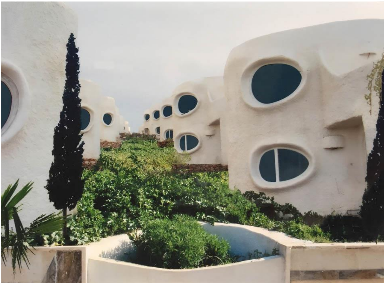
Figure 8. Vue des façades des constructions, Source : https://gratalouparchitecte.ch/project/bouzedjar/ (consulté en Aout 2022)

A nos jours l'expression n'a pas été substituée par bio inspiration ou biomorphisme ou biophilie, elle continue d'être employée malgré l'avènement de tous ces autres concepts semblables qui convergent et se résument au biomimétisme. Ainsi, et sur la base de nos modestes connaissances et recensions sur le sujet, nous jugeons très humblement que la théorie du biomimétisme est le point fédérateur de tous ces concepts et paradigmes suscités.