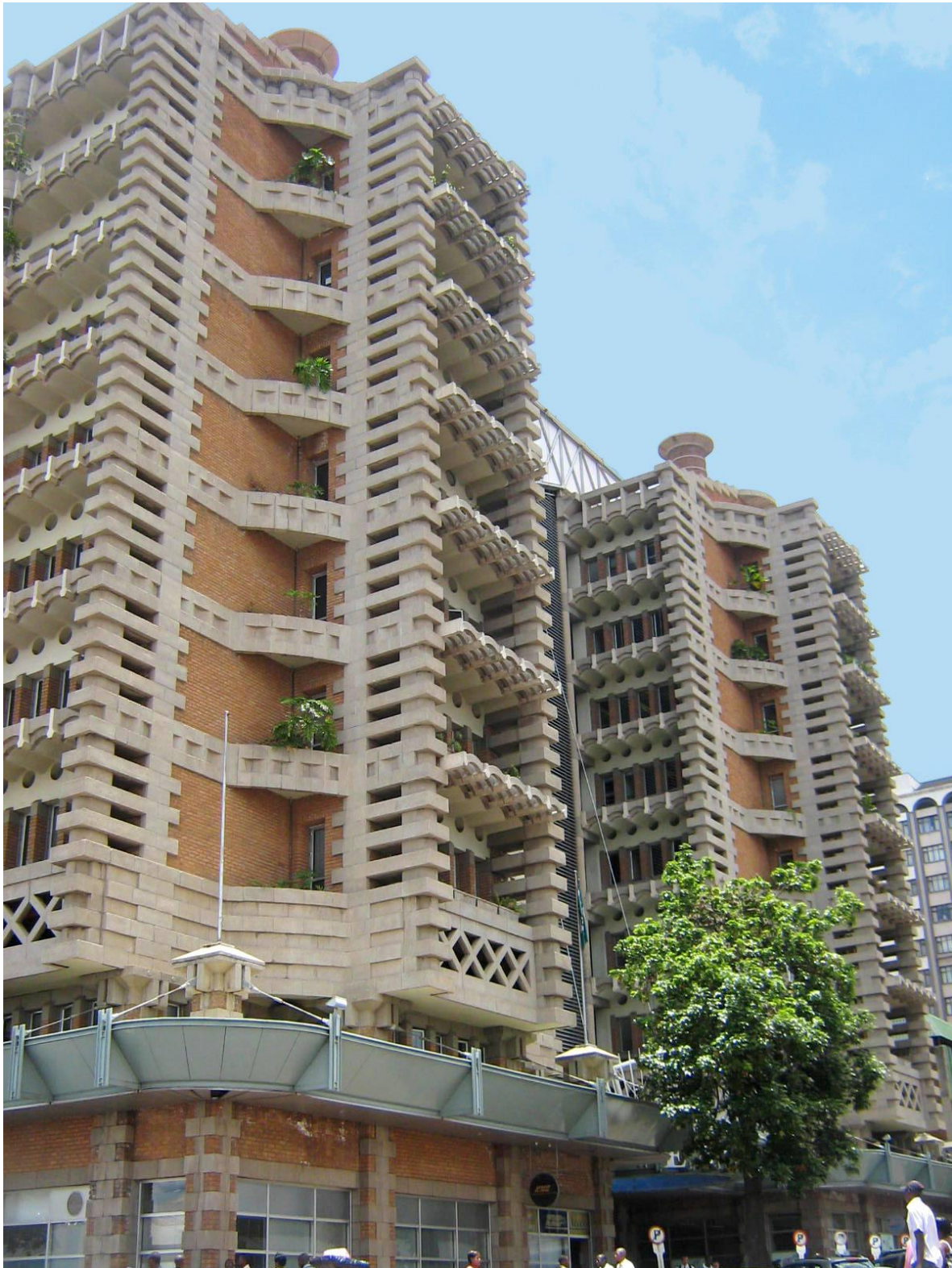
Figure 4. Panorama de l'édifice iconographique